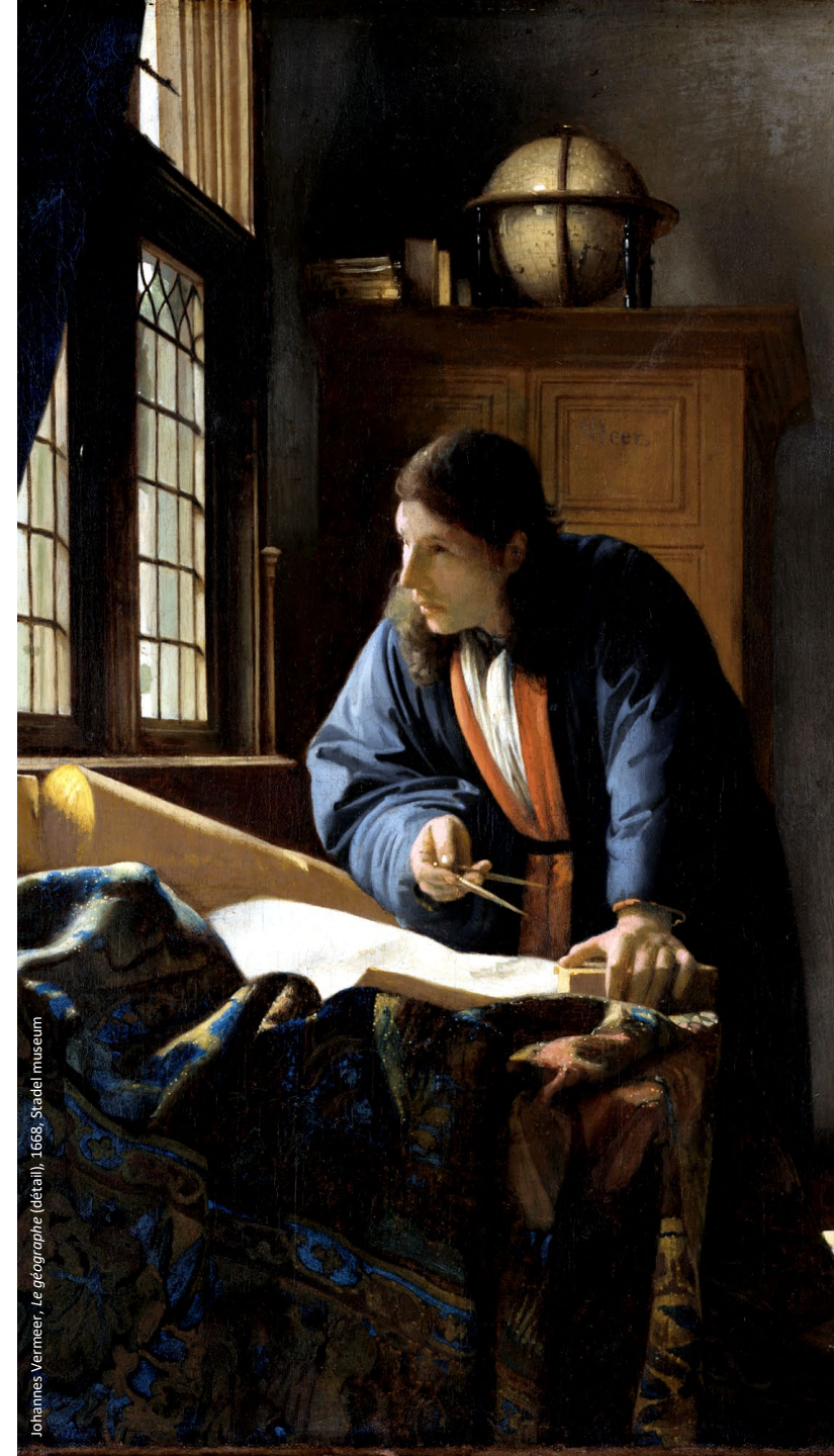
Johannes Vermeer, Le géographe (détail), 1668, Stadel Museum

En cas de nécessité, des modifications de calendrier, de programme et d'intervenants peuvent survenir.