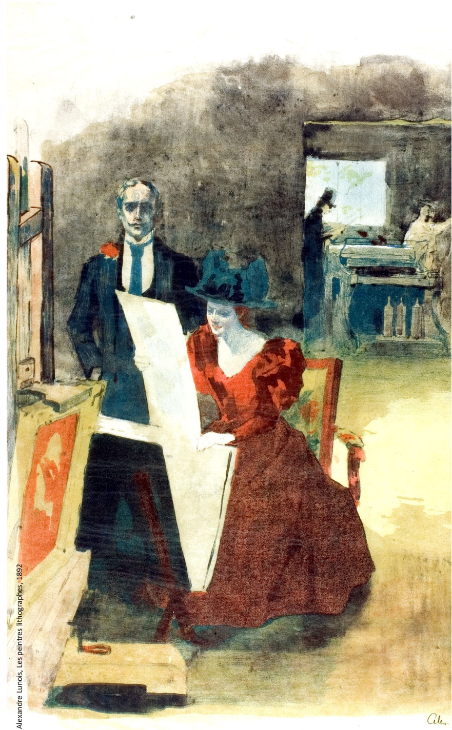
Alexandre Lenoir, Les peintres lithographes, 1892

En cas de nécessité, des modifications de calendrier, de programme et d'intervenants peuvent survenir.