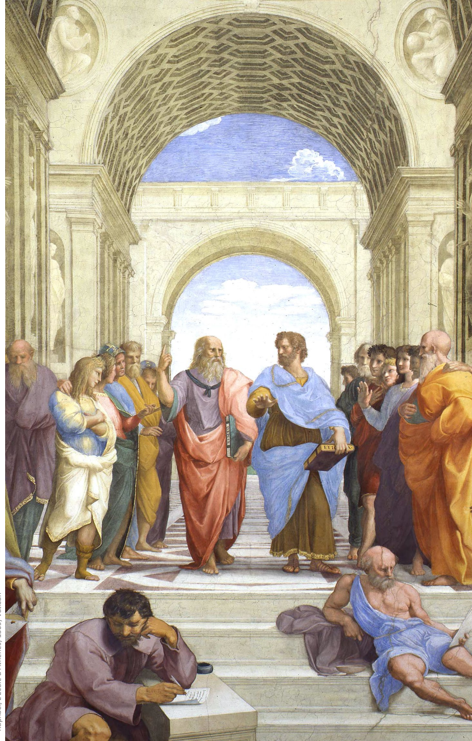
Raphaël, L'École d'Athènes, 1509, Vatican

En cas de nécessité, des modifications de calendrier, de programme et d'intervenants peuvent survenir.